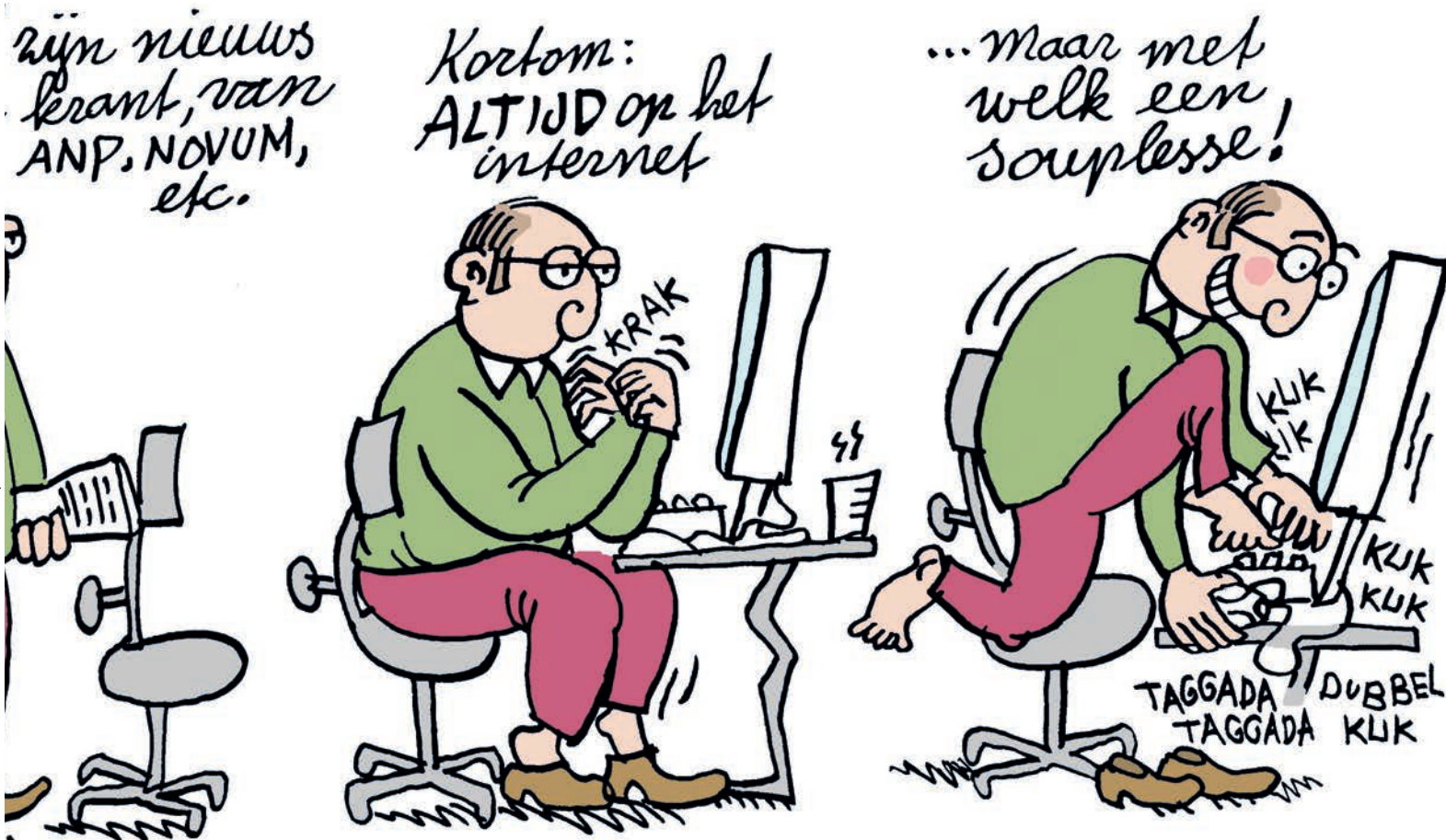
Illustratie: Berend Vonk

Occupational Outlook Handbook (US Labor Department) http://tinyurl.com/2x6lvd The Worst Jobs For The 21st Century http://tinyurl.com/yr44w5 Onderzoek NVJ en Radboud Universiteit http://www.internetjournalist.nl/onderzoek/